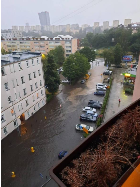
https://szczecin.naszemiasto.pl/nawalnica-nadszczecinem-uwazajcie-na-zalane-ulice-zobacz/ga/c16-8362460/zd/63492926 [deszcz z 9 lipca 2021]